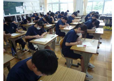
【進路選択に向けて“真剣勝負”する3年生】

技能教科前期試験が終わり、3年生は進路選択に向けて、1・2年生は新人戦に向けて、力を尽くしていくことになります。ご家庭では「栄養・休養・睡眠」と「早寝・早起き・朝ごはん」へのご理解とご協力をよろしくお願いいたします。